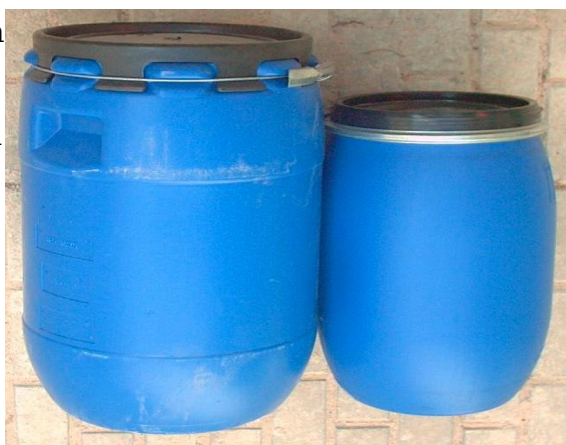
* Envases de residuos químicos *

El material del envase no debe ser atacado por el residuo que contiene, por lo que hay envases de diversos materiales, para distintos tipos de residuos. Un material muy utilizado para los envases es el polietileno. No se deben almacenar residuos en envases de vidrio.